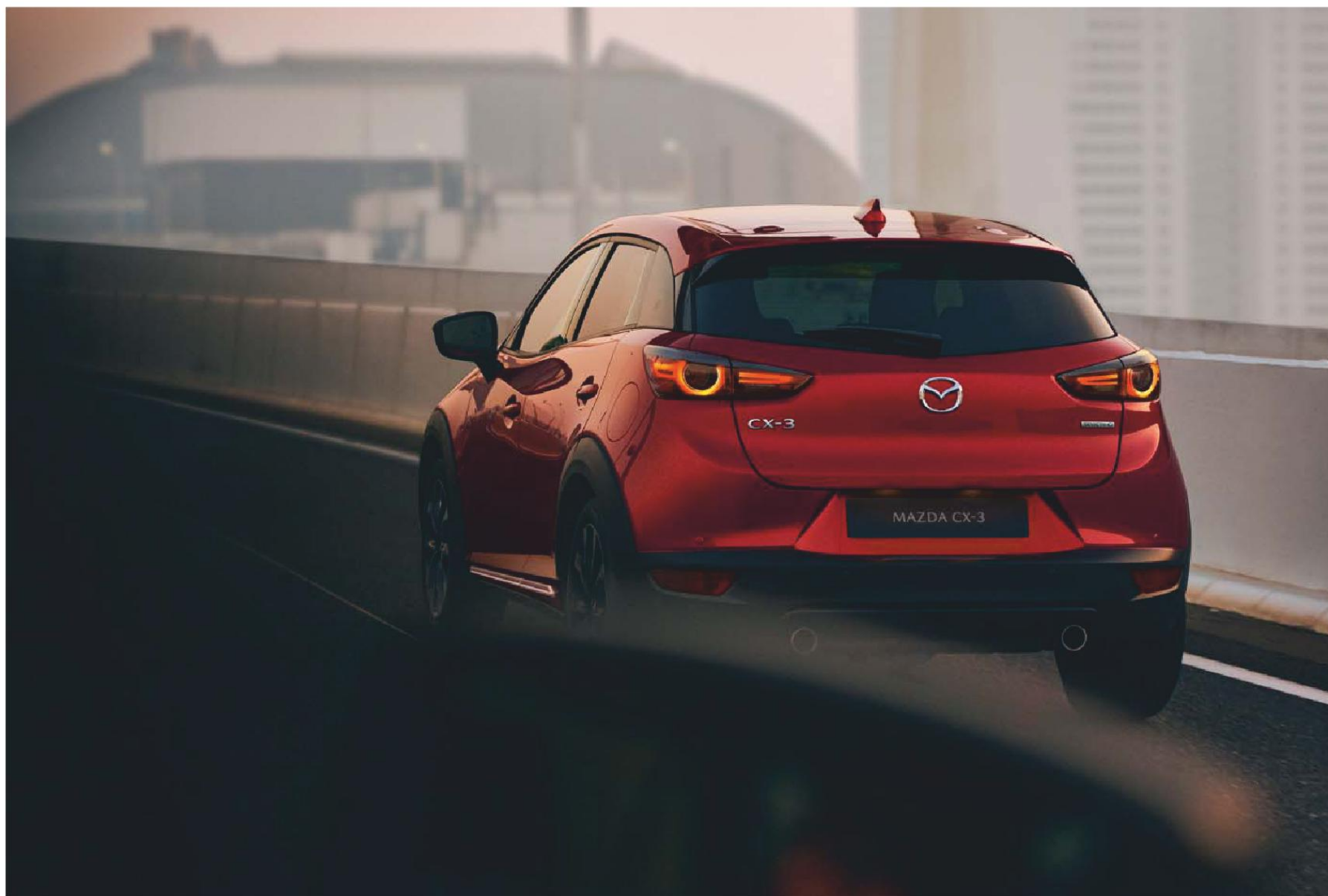
Die Abbildung zeigt einen Mazda CX-3 Selection inkl. Design- & Komfort-Paket in Magmarot Metallic.

Die Mazda Motors (Deutschland) GmbH behält sich im Rahmen Ihrer Politik zur ständigen Verbesserung der Produkte das Recht vor, Änderungen gegenüber den Angaben in dieser Broschüre, z.B. im Hinblick auf technische Daten, Konstruktion, Ausstattung oder Materialien durchzuführen. Diese Änderungen werden den Mazda Vertragshändlern schnellstmöglich mitgeteilt.