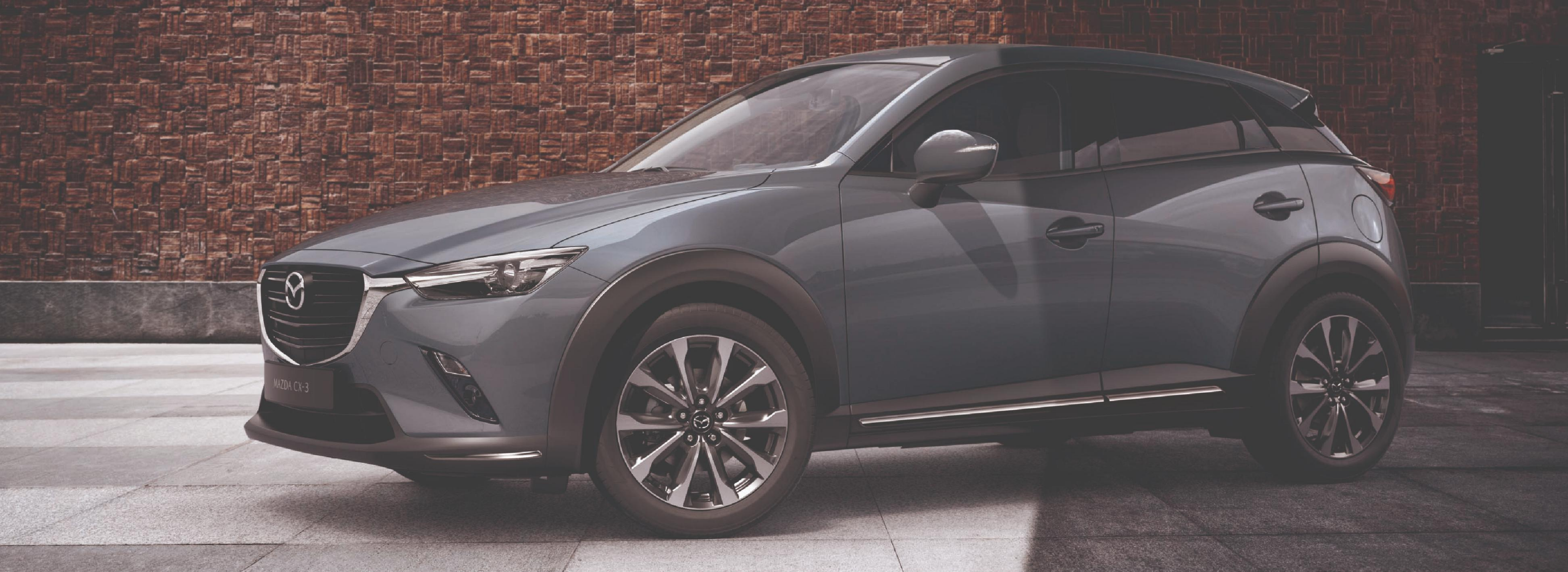
Die Abbildung zeigt einen Mazda CX-3 Selection inkl. Design- & Komfort-Paket und Technik-Paket in Polymetal Grau Metallic.