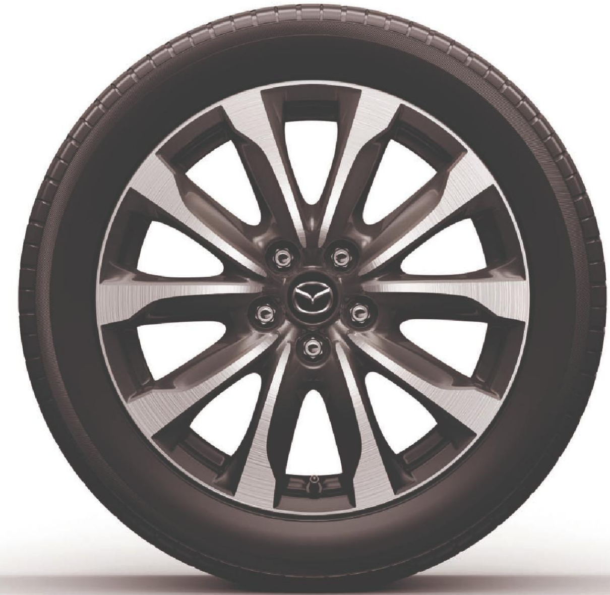
Die Abbildung zeigt die 18-Zoll-Leichtmetallfelgen mit 215/50 R18 Bereifung

Die vollständige Auswahl der verfügbaren Optionen finden Sie im Fahrzeugkonfigurator auf unserer Webseite unter www.mazda.de .