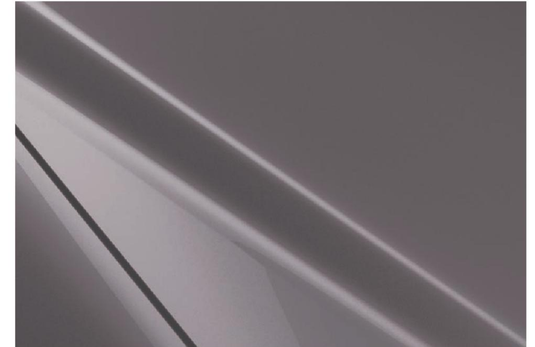
Polymetal Grau Metallic