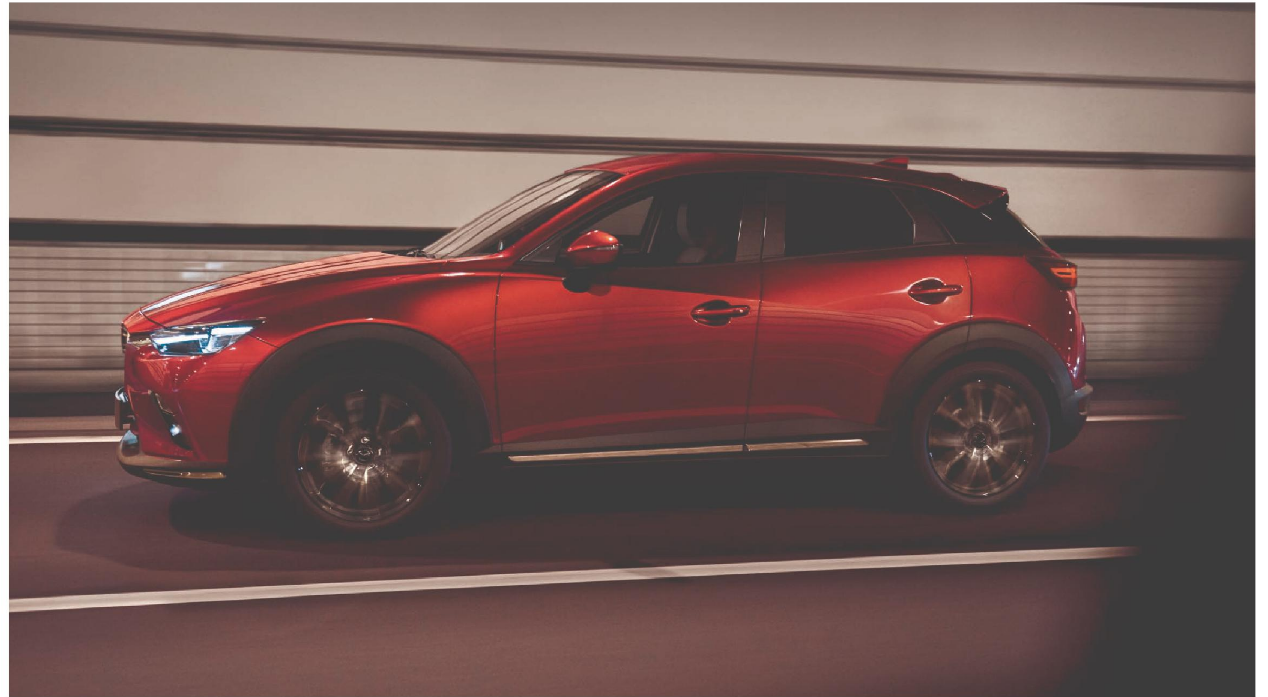
Die Abbildung zeigt einen Mazda CX-3 Selection inkl. Design- & Komfort-Paket und Technik-Paket in Magmarot Metallic.

Wir suchen laufend nach neuen Möglichkeiten, Ihr Fahrerlebnis noch weiter zu verbessern. Aus diesem Grund entwickeln wir Technologien, die Ihnen absoluten Fahrspaß und beruhigende Sicherheit vermitteln. Die verbesserte G-Vectoring Control Fahrdynamikregelung verbessert die Traktion und die Lenkpräzision, indem das Motordrehmoment auf Basis des Lenkverhaltens angepasst wird, um ein sanfteres Fahrverhalten und besseres Ansprechen zu gewährleisten. Durch das System werden nicht nur Handling und Stabilität verbessert - es werden auch weniger Lenkkorrekturen benötigt. Wir entwickeln fortwährend innovative Lösungen, die unter allen Bedingungen ein souveränes Fahrverhalten garantieren und dafür sorgen, dass Sie jederzeit die Kontrolle behalten.