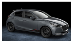
FOLIENDESIGNS oben DA6D-V3-040 G1 unten, Design A DA7E-V3-040 G1 unten, Design B DA7E-V3-040 D1