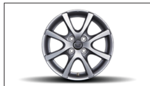
5,5J X 15 LEICHTMETALLFELGE, DESIGN 65 DC3L-V3-810