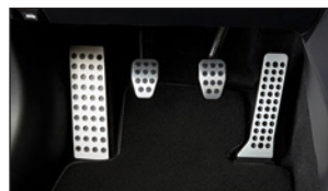
PEDALSATZ UND FUSSTÜTZE AUS ALUMINIUM Bitte sprechen Sie uns an.