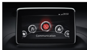
MAZDA NAVIGATIONSSYSTEM 1) BJM7-66-EZ1P