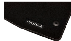
TEXTILFUSSMATTENSATZ Standard DADT-V0-320 Luxury DADV-V0-320