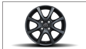
5,5J X 15 LEICHTMETALLFELGE, DESIGN 65A DC3L-V3-810 TG