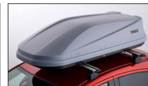
TRANSPORTBOX „TOURING 200“ VON THULE C815-V4-705