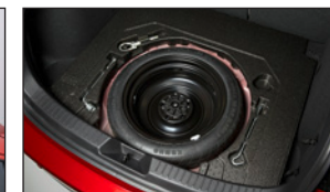
NOTRADSATZ für Prime-Line SPWH-M2-J03L ab Center-Line SPWH-M2-J03H