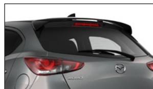
DACHHECKSPOILER QDJE-51-9N0 PZ