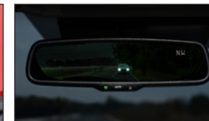
AUTOMATISCH ABBLENDENDER INNENSPIEGEL DD2F-V1-740