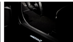
BEGRÜSSUNGSBELEUCHTUNG Kabelbaum C850-V7-055E LED C855-V7-057