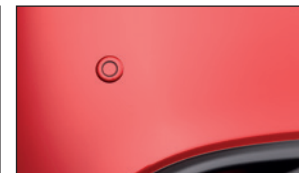
EINPARKHILFE für vorne DADT-V7-285 für hinten DG7R-V7-290B