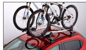
FAHRRADTRÄGER ZUR MONTAGE AUF DEM LASTENTRÄGER C800-V3-854