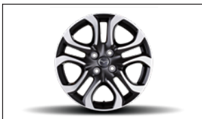
5,5J X 16 LEICHTMETALLFELGE, DESIGN 154 9965-40-5560