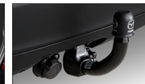
ANHÄNGEZUGVORRICHTUNG Elektro-Satz DC3L-V3-920A DG7R-V3-921B