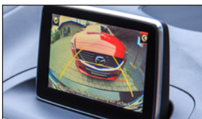
Kamera D09H-67-RC0 Kabelsatz DC3M-V7-531