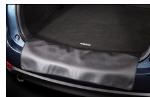
KOFFERRAUMMATTE MIT LADENSCHUTZ KB8M-V0-3581