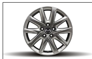
7J X 17 LEICHTMETALLFELGE, DESIGN 67 KB8M-V3-810