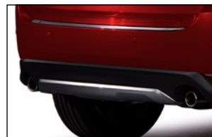
DESIGN-UNTERFAHRSCHUTZ für vorne KB8N-V3-290 für hinten KB8N-V3-300