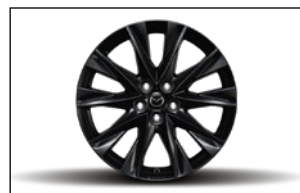
7J X 19 LEICHTMETALLFELGE, DESIGN 68B KB8P-V3-810-SB