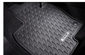
ALLWETTER-PASSFORMMATTEN- SATZ KB8M-V0-351