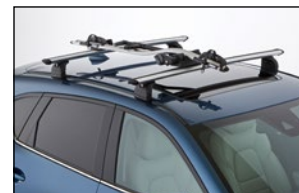
LASTENTRÄGER Dachleiste links KB8N-V3-840 Dachleiste rechts KBYA-50-9L0A KBYA-50-9H0A