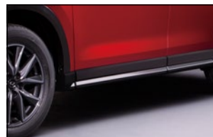
SEITENSCHWELLERSATZ 1) QKFE-51-R10