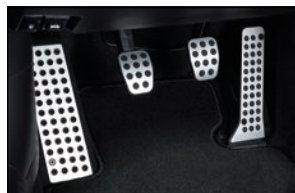
PEDALSATZ UND FUSSSTÜTZE AUS ALUMINIUM Gaspedal BHR2-V9-091B Bremspedal (Automatikgetriebe) KOE1-V9-093A Kupplungs- und Bremspedal (Schaltgetriebe) BHR1-V9-097E Fußstütze BHR1-V9-095