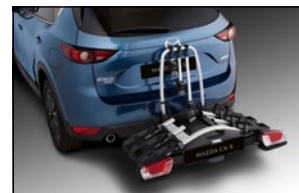
FAHRRADTRÄGER FÜR DREI FAHRRÄDER 4100-79-620