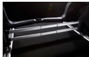
KOFFERRAUM-ORGANIZER Fixierset GS1D-V0-582A Schienen KB8M-V0-581