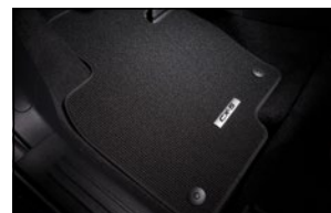
TEXTILFUSSMATTENSATZ Luxury KB8N-V0-320 Robust KD3M-V0-320