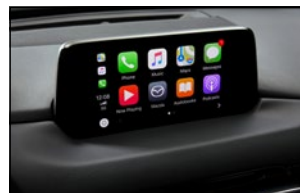
ERWEITERTE SMARTPHONE- INTEGRATION VIA APPLE CAR- PLAY™ UND ANDROID AUTO™ MZDC-AA-CAR DE