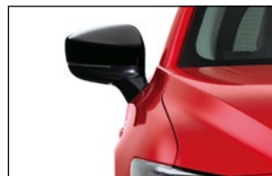
AUSSENSPIEGELVERKLEIDUNG Schwarz KB8N-V3-650 Silber KF1J-V3-650