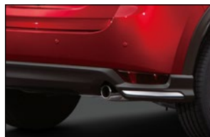
HECKSCHÜRZE 1) QKFE-50-360