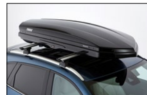
TRANSPORTBOX VON THULE Touring 200 C815-V4-705 Touring 780 C816-V4-705 Dynamic M C817-V4-705