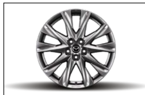
7J X 19 LEICHTMETALLFELGE, DESIGN 68 KB8P-V3-810