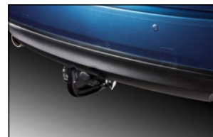
ABNEHMBARE ANHÄNGEZUG- VORRICHTUNG KB8M-V3-920 Elektrosatz, 13-polig mit C2 KB8M-V3-921A