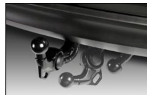
SCHWENKBARE ANHÄNGEZUG- VORRICHTUNG KD3M-V3-920B Elektrosatz, 13-polig mit C2 KL3B-V3-921 Hitzeschild KD3M-V3-92E 2)