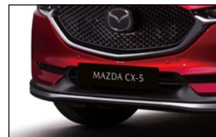
FRONTSCHÜRZE 1) QKFE-50-AH0