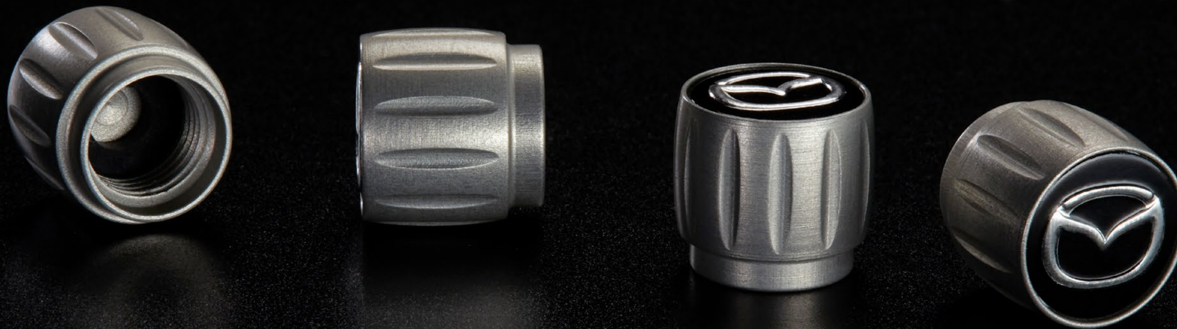
Abbildung zeigt Ventilkappensatz bestehend aus vier Stück mit Mazda Logo.

Ihr Mazda CX-5 verdient das Original. 100 % Mazda Original Zubehör.