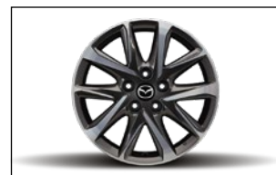
7J X 17 LEICHTMETALLFELGE, DESIGN 67A KB8M-V3-810 TG