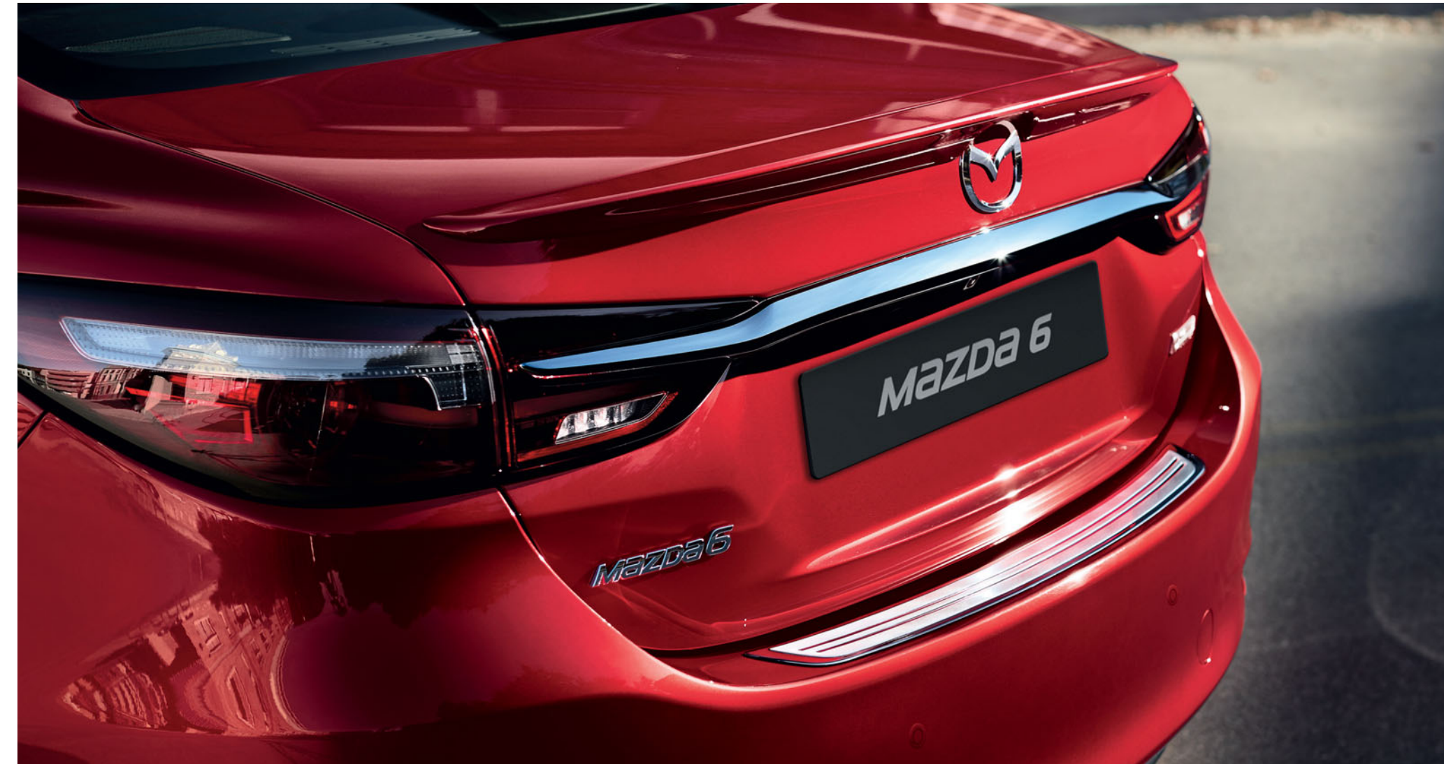
Heckspoilerlippe und Trittschutzleiste aus Edelstahl