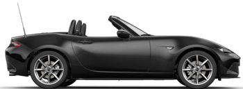
ONYXSCHWARZ METALLIC (41W)