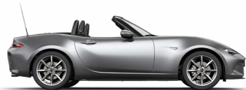
MATRIXGRAU METALLIC** (46G)