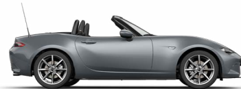
POLYMETAL GRAU METALLIC** (47C)