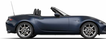
MITTERNACHTSBLAU METALLIC (42M)