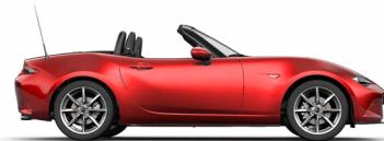
MAGMAROT METALLIC** (46V)