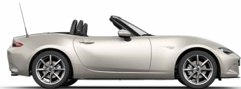
PLATINUM QUARTZ METALLIC (47S)