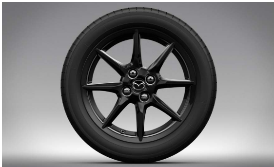
16-Zoll-Leichtmetallfelgen in Schwarz