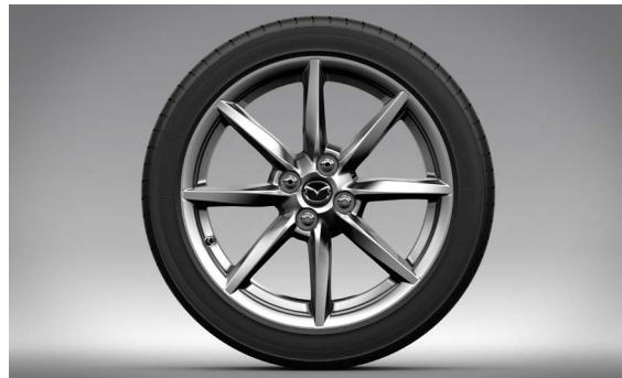
17-Zoll-Leichtmetallfelgen in Bright Dark